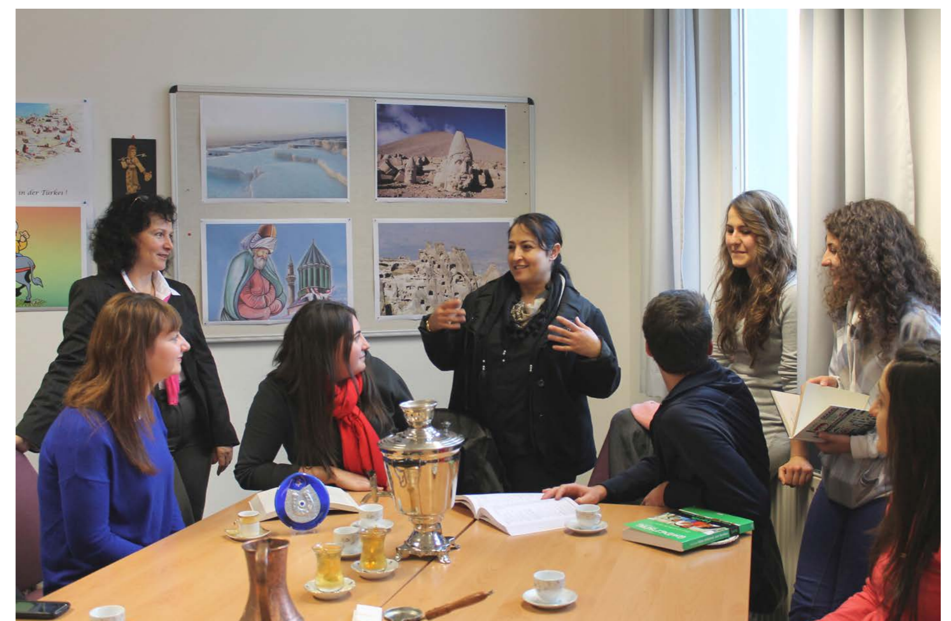
Kurs Türkisch als Herkunftssprache