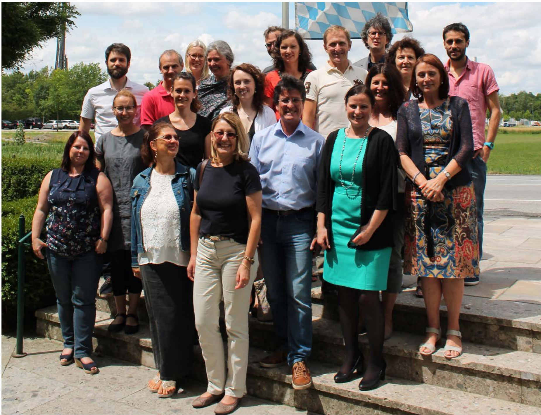
Fakultät Interdisziplinäre Studien im Sommer 2017

Der Bereich Sprachen ist Teil der am 15. März 2016 gegründeten Fakultät Interdisziplinäre Studien. Was wird dort angeboten?